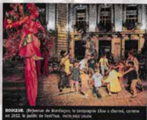
DOUCEUR. (Révision de Bonifacio) la compagnie Litou a charmé, comme en 2012, le public de Festi'rue.