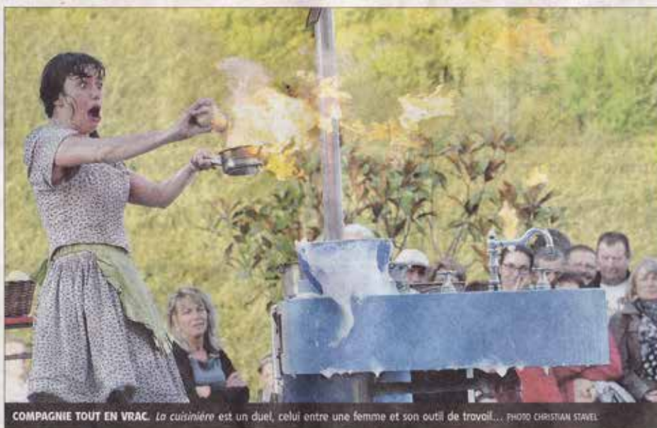
COMPAGNIE TOUT EN VRAC. La cuisinière est un duel, celui entre une femme et son outil de travail...

Et Betty est une star, à en croire le fan-club qui s'attroupe après la représentation. Enfants et parents se précipitent pour acheter une petite carte de La cuisinière . Le oral ? Récol-