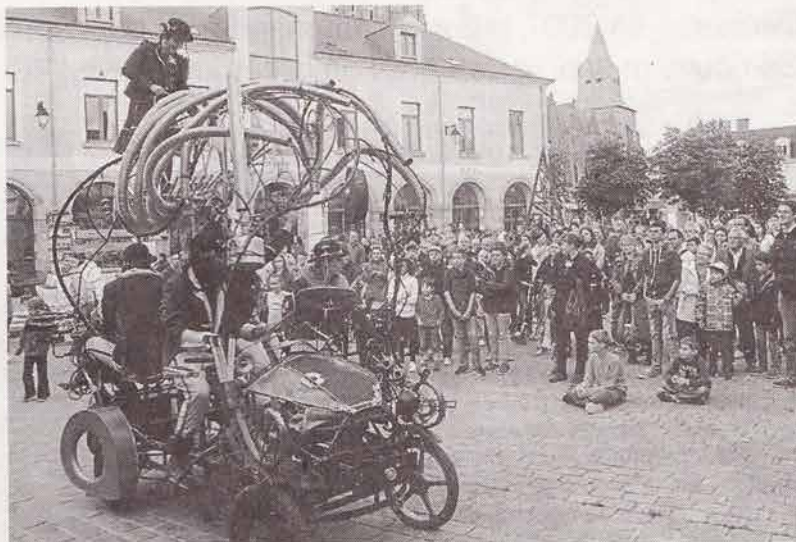
Les Frappovicht dans un incroyable spectacle sonore et rythmique.

Le festival des arts de la rue DésARTiculé a fait étape, samedi soir, dans la commune, avec trois spectacles à l'affiche. Le public, venu très nombreux, s'est régalé des trois univers proposés.