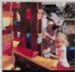
GLOU. La foule aux fontaines musicales d'Étienne Ferré.