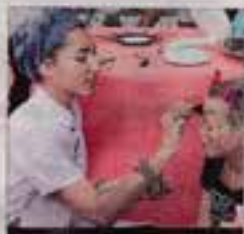
MAQUILLAGE. Éclatantes au bonnet avec Chérie d'Éclat.