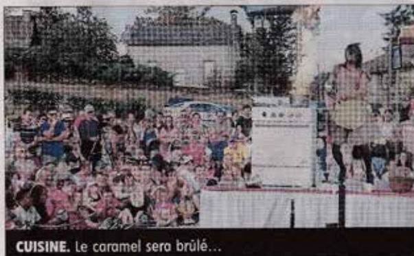
CUISINE. Le caramel sera brûlé...

Mardi, la municipalité a reçu la troupe « Tout en vrac » pour le spectacle La cuisinière dans le cadre des Préalables au théâtre de rue aurillacois. En décor, une cuisine tout équipée et sur scène une demoiselle fraîchement sortie d'un dessin de pin-up des années 50.