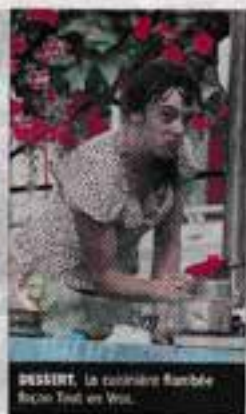
DESSERT. La cuisinière flambee Bécot Test et Test.