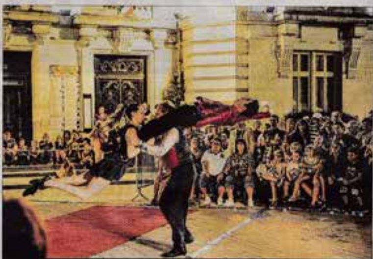
ACROBATES. No incroivable, la compagnie En Pain Wel allie le foue, le charme et l'humour, dans la grande tradition du cirque burlesque particulièrement apprécié à Decize.