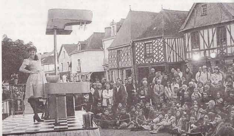
La cuisinière, un spectacle court d'une intensité explosive, à revoir à Moulins, vendredi.

Vendredi 24 juin , à partir de 18 h 30 et samedi 25, à partir de 15 h 15, à Moulins, 5 € le vendredi, 10 € le samedi, pass festival à 12 €, gratuit pour les moins de 14 ans. Sur internet : www.desarticule.fr