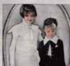
PORTRAITS. Avec la compagnie La Grenouille bleue.

de la compagnie Litou, samedi soir en nocturne, a fait l'unanimité : « Les gens veulent un peu de féerie. Ils ont besoin qu'on les fasse rêver. » Le climat national, encore plus étouffant et nerveux depuis l'attentat de Nice, n'a pas suscité de « réaction » à Decize, ce week-end, mais pesé un peu plus sur les épaulés des organisateurs : « Festi'rue, c'est une boule d'organisation et une responsabilité. Mais on ne peut pas s'empêcher d'y penser. » ■